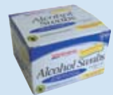
Hisopos de alcohol