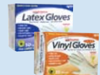
Guantes de látex, látex sin polvo y vinilo

Walgreens Diabetes & You WIC# Inglés: 962592 Español: 962543