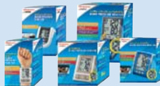
Monitores para presión sanguínea Manual Inflate, Automatic Wrist, Automatic, Deluxe Automatic y Ultra-Deluxe Automatic — ¡todos con exactitud clínicamente comprobada!